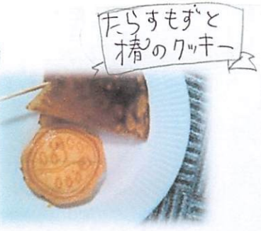
たらすもぐと 椿のクッキー