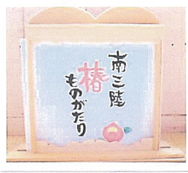
まちづくりのかみばい