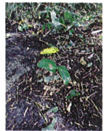
実生の椿の芽も 発見!

7. 後半は神社の秋まつりに 合わせて 境内掃除をして頂きました。 おかげさまで すっきりと みんなの表情も 輝いてみえました。