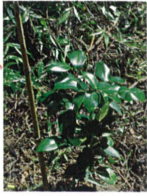
すくすく大きく 育てネ