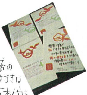
• 椿の はがきは 苗木代に。 これ大好評です!!