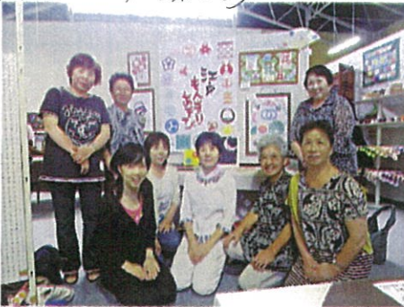
• 作品展にも参加しました