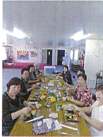
• たまにはお風もご一緒に