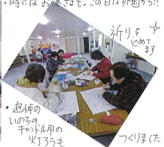
• 追悼の いのちの チャットル用の 灯ろうも つくりました