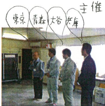
主催 役場のみなさんは いろいろご出身でしたネ