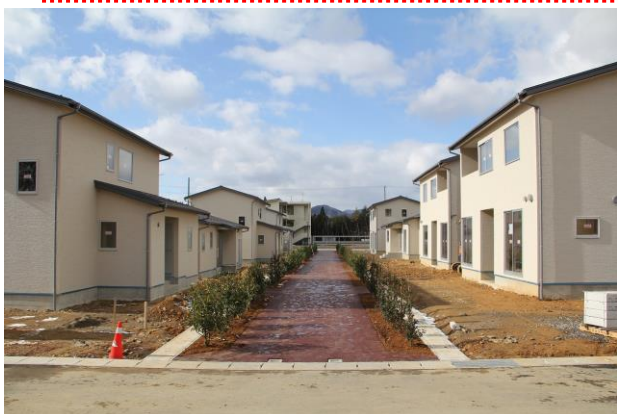
(完成した戸建ての公営住宅。左の奥は3階建ての集合タイプの公営住宅。12月30日撮影)