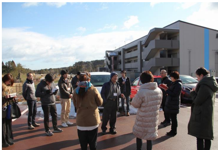
(復興みなさん会のメンバーの案内で、戸倉の高台移転団地と復興公営住宅を見学する東松島市の推進員一行)

さんさん商店街での昼食を挟んで、午後は志津川上山八幡宮社務所を会場に復興みなさん会との研修・交流会を開催。それぞれの地域の復興公営住宅の現状について情報を共有し、支援の取り組みについて話し合ったほか、お互いの活動について情報・意見交換を行いました。