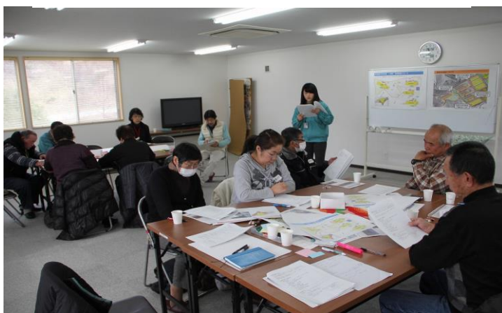
(旧志津川保健センターで開かれた「くらしの懇談会」)