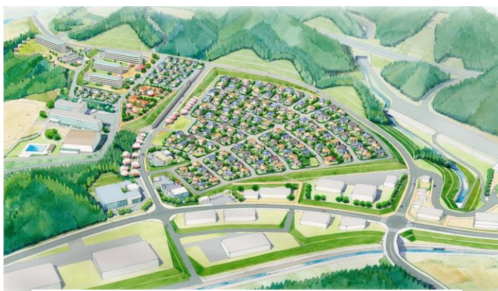
(志津川地区・中央団地イメージ図)

このうち23日午前中に開かれた中央①街区の懇談会には住民6人が出席。「お茶っこタイム」と自己紹介の後、役場の担当者が工事の進捗状況について現場の写真や資料などを使って報告。さらに入居までのスケジュールや必要な手続き、管理自治会などに関する説明が行われました。また、現在仮設住宅で使用している備品のうち、県や町から譲り受けて復興公営住宅に持ち込むことができる備品についても詳しい説明が行われました。復興みなさん会のメンバーも、ファシリテーターや記録係として、懇談会のサポートをさせていただきました。