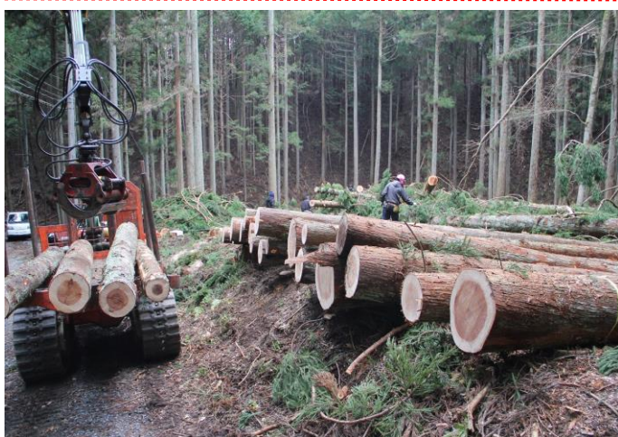
(昨年 10 月に伐採し、葉枯らしにしていた立木の玉切り作業。＝戸倉地区波伝谷の山林、1 月撮影)