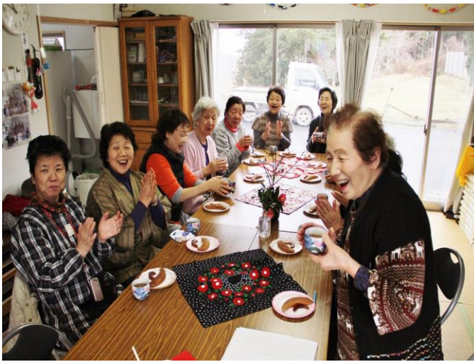
(お茶会の様子=志高仮設集会所)