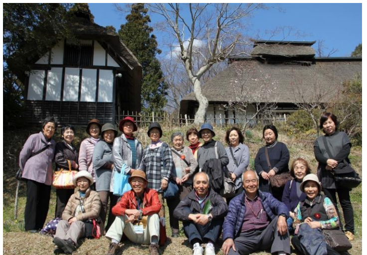
(ひころの里「松笠屋敷」をバックに記念撮影する参加者)

復興みなさん会が主催する「椿のお茶会&ふるさと巡りツアー」が 3 月 28 日、町内で行われ、南方仮設住宅に暮らす住民など 20 人が参加しました。バスで町内入りした参加者たちは、復興みなさん会のメンバーの案内で、戸倉と志津川地区の復興状況を見学したほか、雲南神社近くの八幡川で椿の花流しをして震災の犠牲者の霊を慰めました。昼食時には、入谷ひころの里に移動し、「ばっかり茶家」で会食しながら和やかに交流しました。