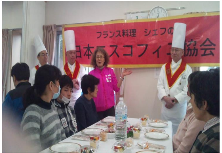
(名足復興公営住宅集会所でのイベントの様子)

フランス料理のシェフらでつくる一般社団法人日本エスコフィエ協会のメンバーが 3 月 20 日、歌津地区の「町営名足復興住宅」で、地元の魚介や野菜をふんだんに使った「南三陸フイヤベース」を作り、入居者らをもてなしました。被災者を料理で元気づけようと、日本最高峰に立つフランス料理長たち 17 人が、本格フレンチに腕を振るい、住民およそ 120 人がプロの料理人が作った美食を味わいました。