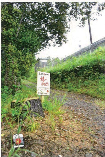
椿の小路が避難路に!