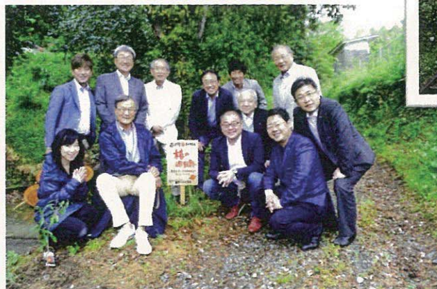
西宮D-アリークラブの皆さんと♡