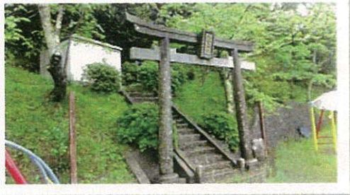
① 南三陸町・西宮神社の境内に。