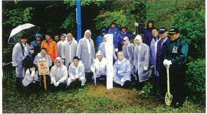
大雨の中の記念撮影 (佐:30-アリークラブから応援が!)