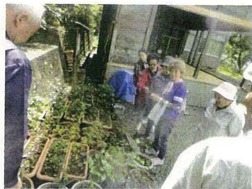
椿の苗木を100本 育てています