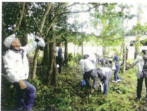
戸倉では沢山とれたかな!?