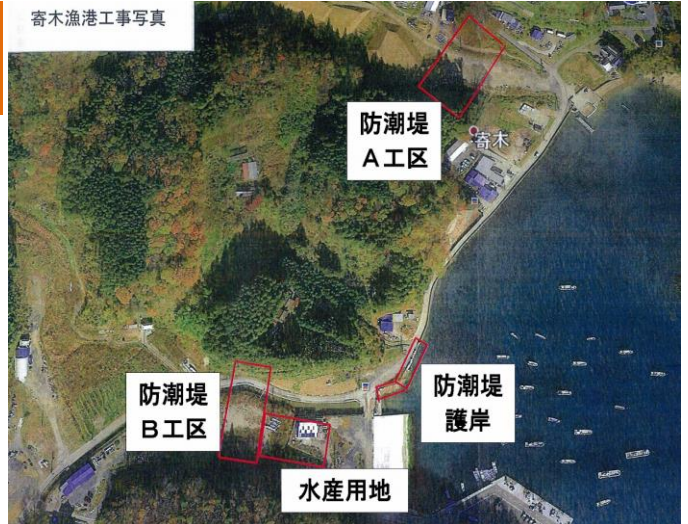
寄木漁港工事写真

歌津地区寄木漁港の海岸防潮堤災害復旧工事説明会が4月26日、寄木地区集会所で開かれました。住民およそ30人が出席し、役場建設課と工事を施工する山庄建設株式会社の担当者から工事内容の説明を受けました。防潮堤の築堤は2ヶ所で、延べ149.7m。護岸復旧が45.1mです。このほか水門工、陸閘工が各1、河川改修工が延長93.3m、水産関係用地整備工事（アスファルト舗装）1,700㎡などとなっています。工事着手は5月11日の予定で、平成31年12月20日の完成が見込まれています。