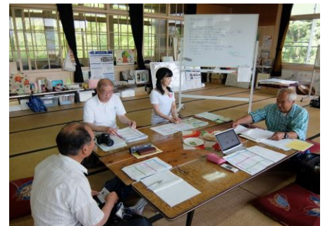
(定時総会後の理事会の様子)