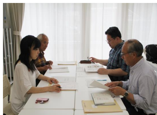
(総会前に行われた理事会の様子)

ほのまちづくり支援事業補助金」、赤い羽根共同募金「みやぎチャレンジプロジェクト」助成金をいただくことが決まっております。これらを活用して、復興公営住宅での「椿はな咲くまちづくりお茶会」、移動交流・外出支援、「復興まちづくり通信」の発行などコミュニティ再生支援の活動を継続します。