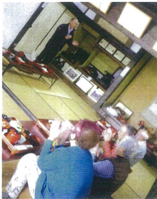
入谷ひろの里 ばっかり茶屋