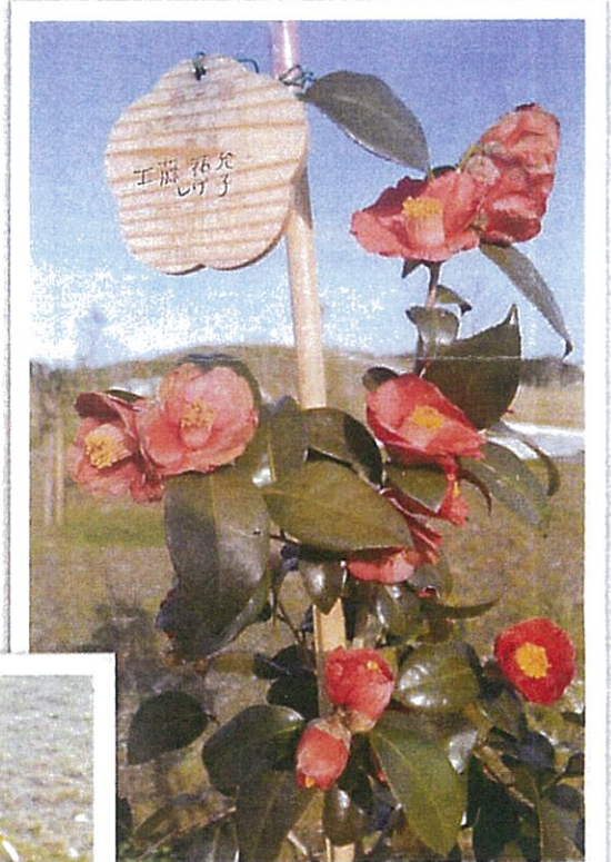
ネームプレートは雨風で多少劣化してきました、それも味わい。