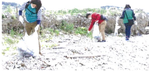
しおかぜ学校の授業として♪