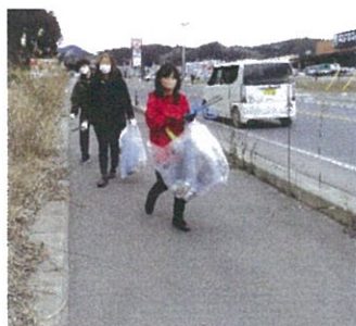
暮らしのかけらに出逢いながら♪