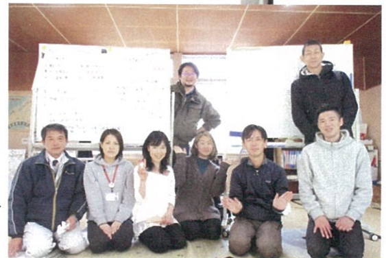
みなさまお疲れさまでした