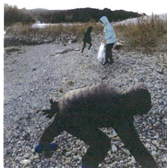
鳥のかんさつをしながら♪