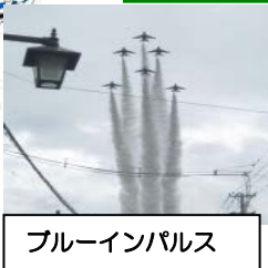
ブルーインパルス