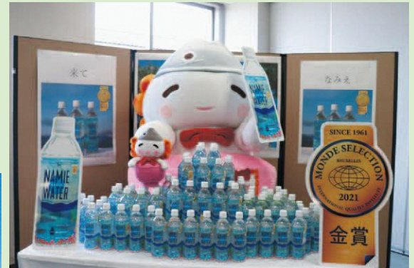
「NAMIE WATER」 モンドセレクション 「金賞」受賞（6月）