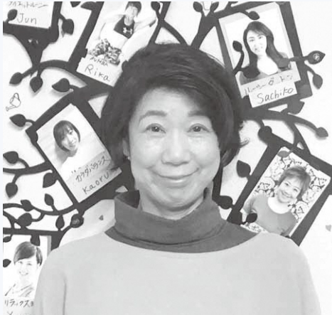
▲共に活動するスタッフさん方の写真の前で

年目のお祝い を考えていた 矢先に、新型 コロナウイル ス（以下、新 型コロナ）感 染拡大が起き ました。10年 前は浪江町の 方々も結構参 加いただきましたが、当時 50、60歳の方