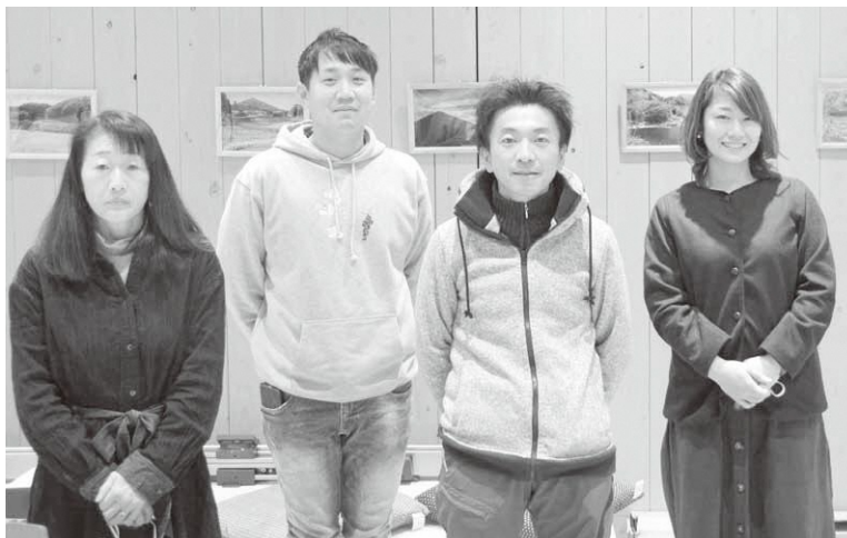
▲取材会場となった葛尾村復興交流館「あぜりあ」にて

ここに、川俣町と近畿大学の連携事業によるアンスリウム栽培者の募集があり、応募。11人が川俣町全域に建てた各々のハウスで切磋琢磨することになりました。熱帯アメリカ原産のアンスリウムは日本国内でもまだ生産が少なく、競争相手も少ないことから、震災後の新しい花き産業としての可能性は大きいと思っています。