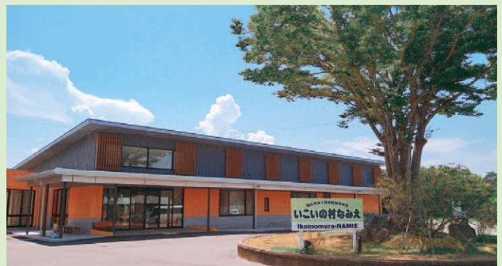
いこいの村なみえグランドオープン（8月）