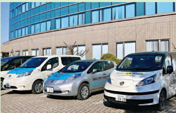
なみえスマートモビリティ実証実験（11月～2月）