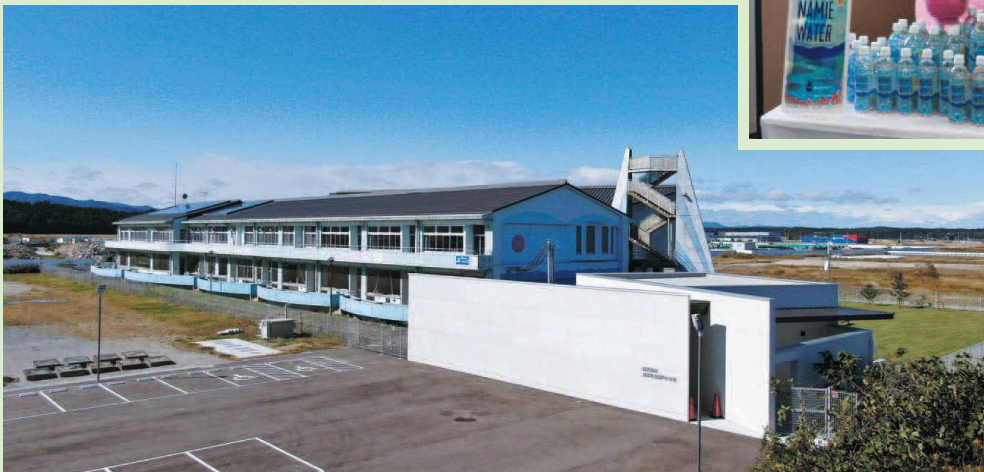
震災遺構浪江町立請戸小学校開館（10月）