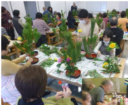
過去に開催した 交流会の様子

2014年6月から活動を開始した宮城駐在では、今までに11回の交流会を開催し、183件のお宅にお邪魔してきました。