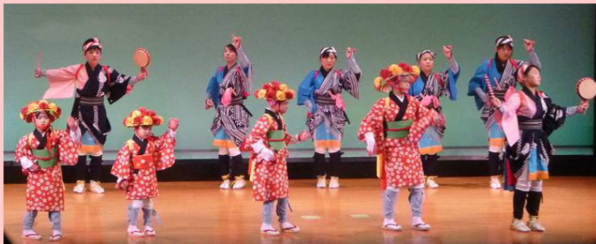
請戸芸能保存会の「請戸の田植踊」

3/12 に二本松市で行われた「第5回なみえ3.11復興のつどい」に支援員がお邪魔しました。当日は、町民による発表会の他に、二本松市の安達運動場仮設住宅でロケが行われた映画上映などがありました。福島県内外から多くの町民が集まり、会場のおちこちで久しぶりの再会を喜ぶ声が聞こえました。