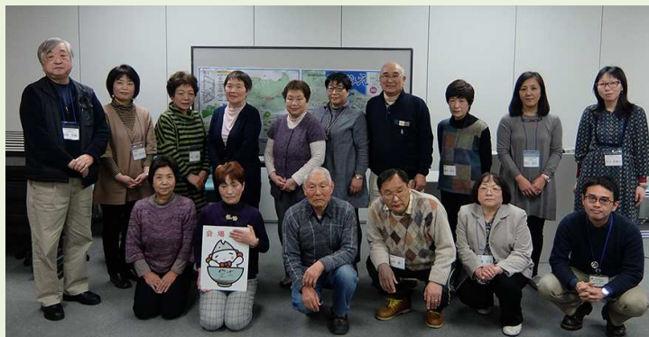
最後に参加者と記念写真

交流会の最後にはみなさまから「また、やってね!」という、嬉しいお言葉も頂きました。これからもたくさん交流会を企画していきたいと思います。今後、交流会にお越しの際は、ぜひみなさんのお知り合いをどんどん誘って、いっぱい繋がりたいです。